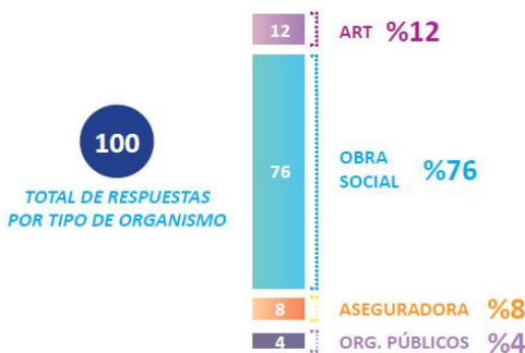
PARTICIPACION POR TIPO DE ORGANISMO